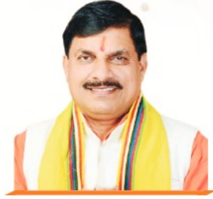
डॉ. मोहन यादव