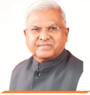
श्री मंगूभाई पटेल